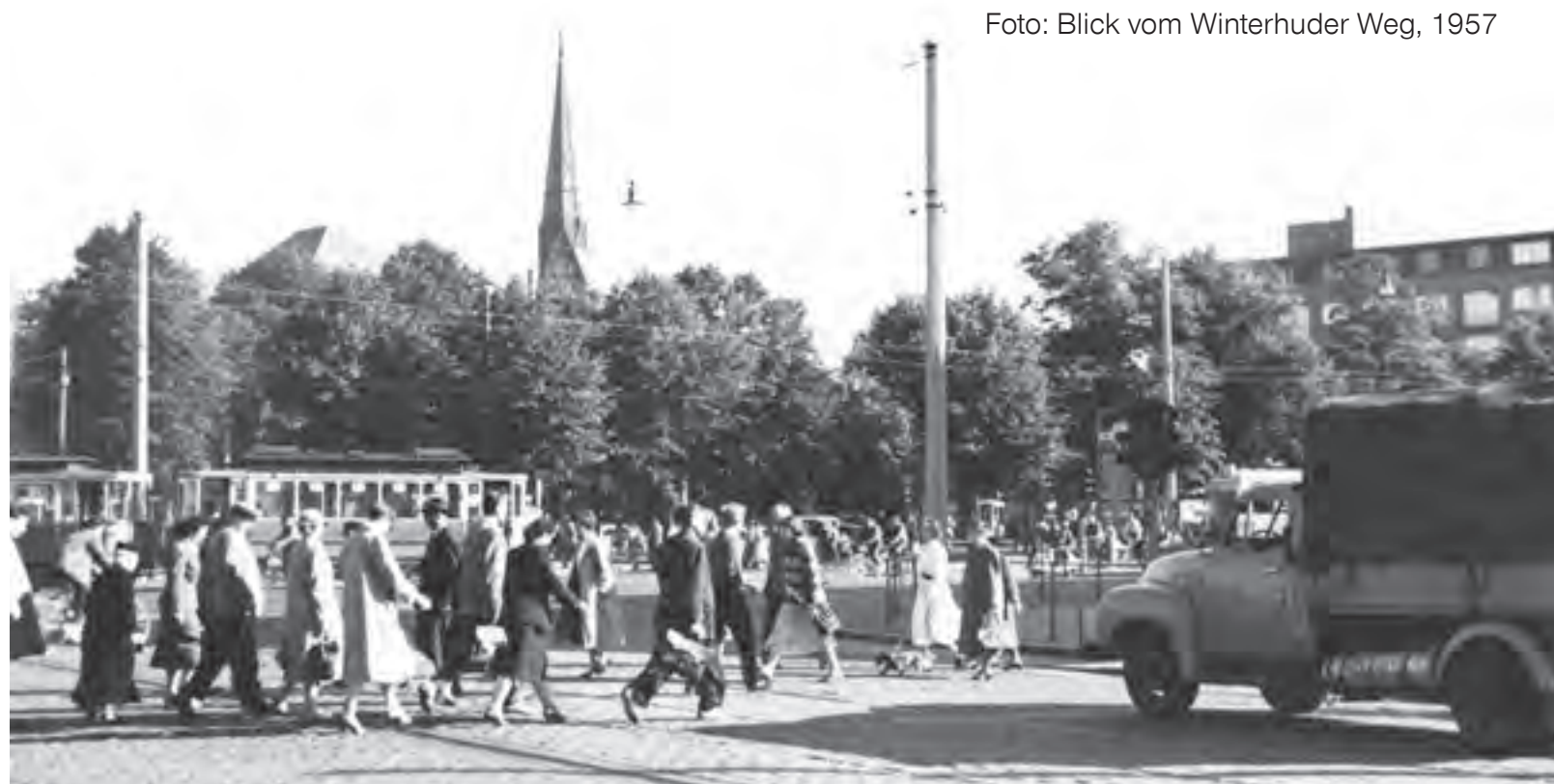
Foto: Blick vom Winterhuder Weg, 1957

Im September werden beide Rundgänge wiederholt. Die genauen Termine folgen.